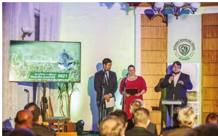
Udílění cen proběhlo ve středu 20. října večer v lesnické škole v Hranicích.